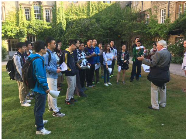
图为哈福特学院教师为同学们讲述哈福特的历史

致远学院的同学到达牛津已有一周，在初步感受了牛津的城市面貌、生活和授课之后，哈福特学院为同学们准备了一个更为详尽的牛津历史文化主题一日游，同学们对牛津这座城市和学校也有了更深入的了解和思考。